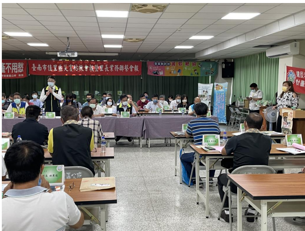
立架宣導性平 CEDAW 理念