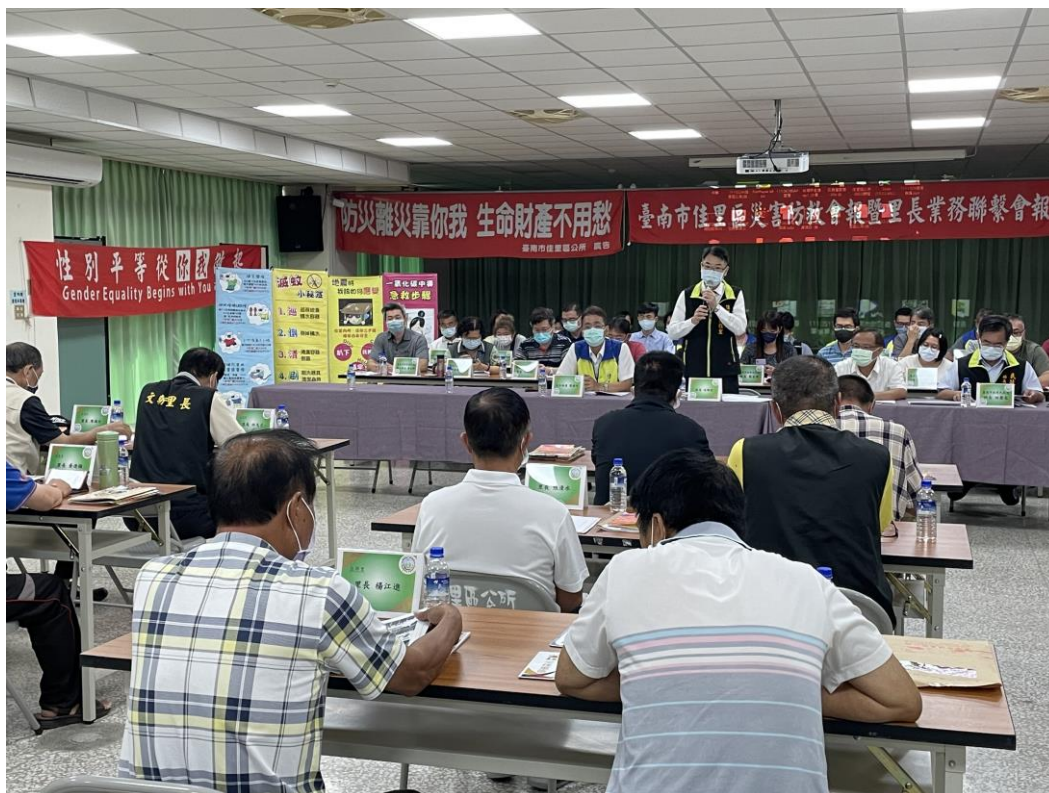
區長宣導性平 CEDAW 觀念