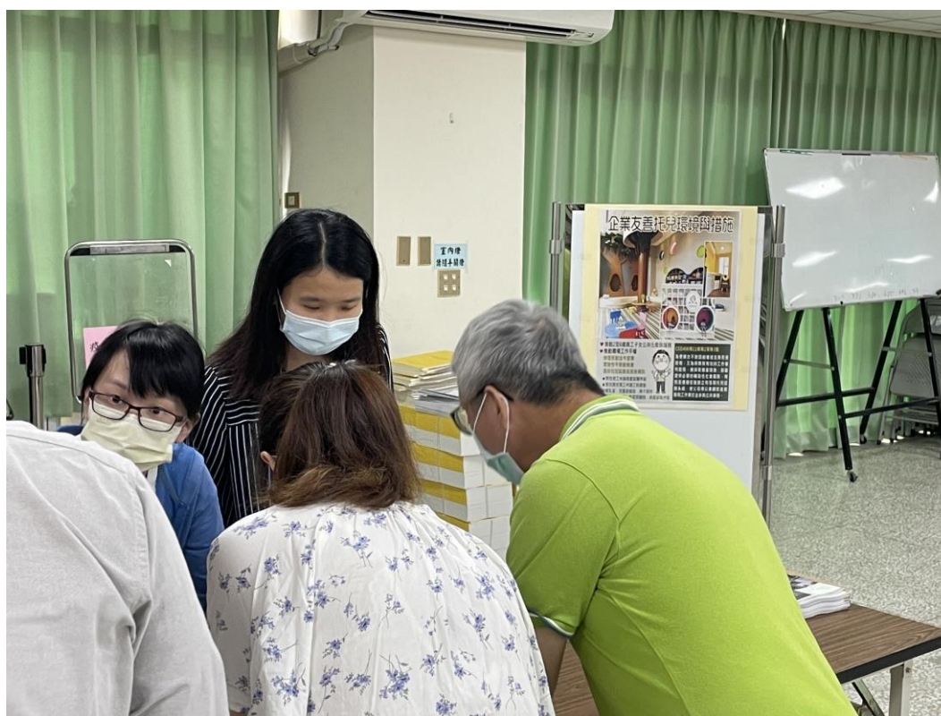
簽到處擺放性平標語