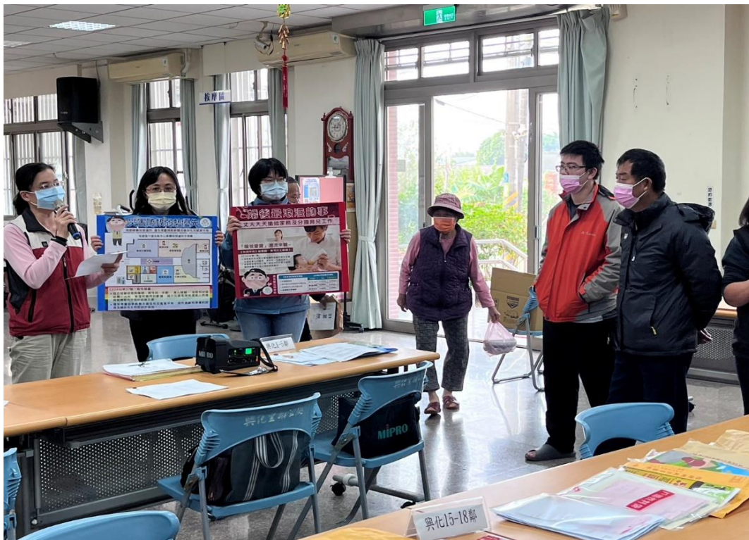
佳里區 112 年第 1 次措施「綠色環境給付計畫」申報(下鄉)