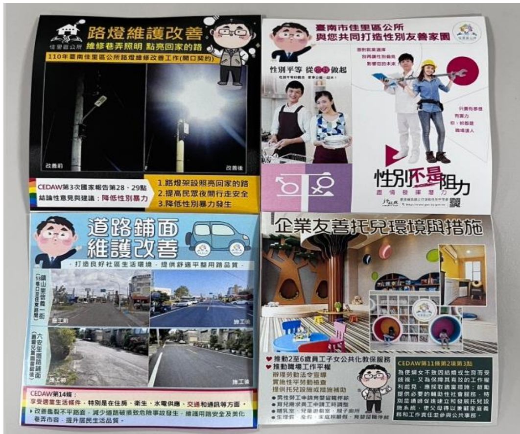
製作文宣品宣導 CEDAW 觀念與日常應用