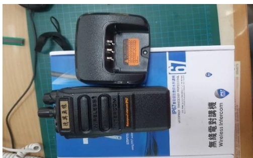
113 年納骨堂對講機設備購置計畫