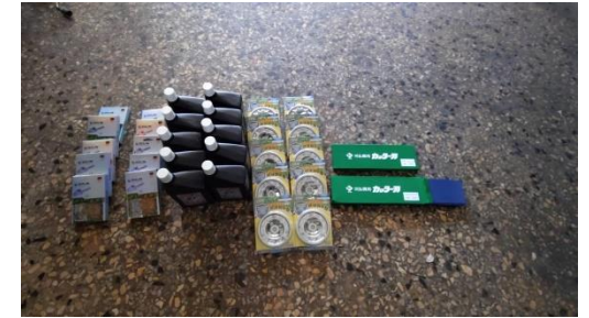
巷埔里 113 年環境清潔用品購置計畫