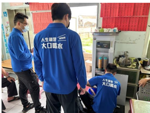
將軍里飲水機濾心購置計畫