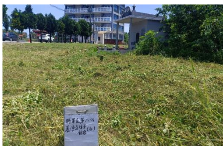
將軍區納骨堂周邊環境整理及便道兩側雜草清除計畫