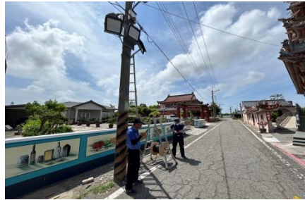
將軍里監視器系統裝設計畫