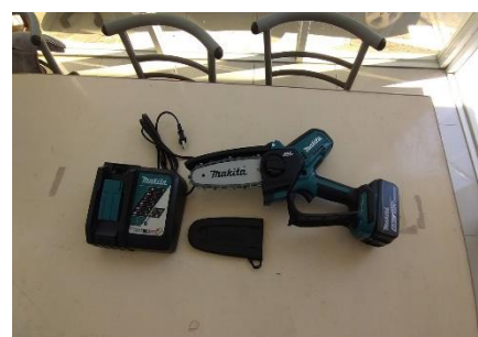
113 年度巷埔里無刷鋰電鏈鋸機