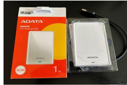
將軍里隨身硬碟購置計畫