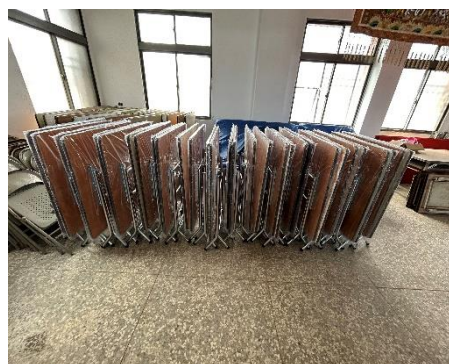
將軍里置物櫃及合桌購置計畫