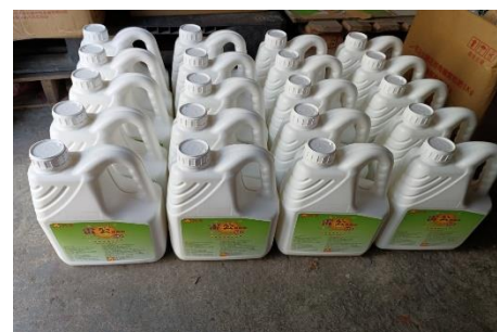
113 年度巷埔里殺蟲劑購置計畫