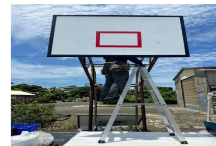
將軍里籃球架更換籃板計畫