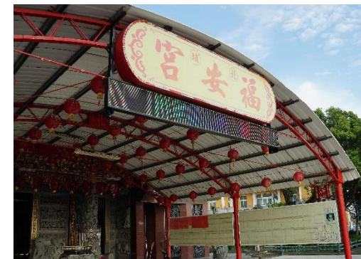
113 年度巷埔里單面高亮度全彩字幕機購置計畫