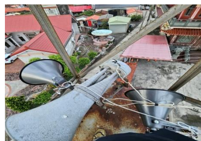
將軍里廣播系統維修計畫