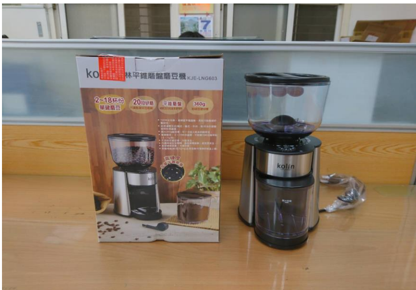
巷埔里磨豆機購置計畫