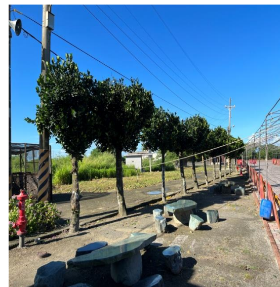
將軍區納骨堂周邊樹木修剪及便道兩側雜草清除