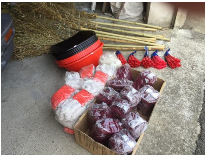
將軍里環境整頓打掃用具購置計畫