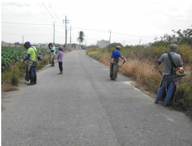
111 年度巷埔里轄內雇工除草環境維護計畫