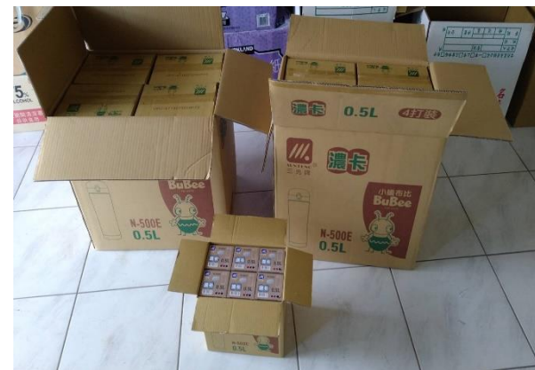
112 年度巷埔里宣導品購置計畫