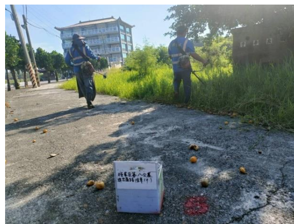
將軍區納骨堂周邊環境整理及便道兩側雜草清除計畫