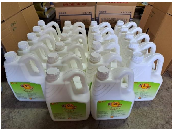
112 年度巷埔里殺蟲劑購置計畫