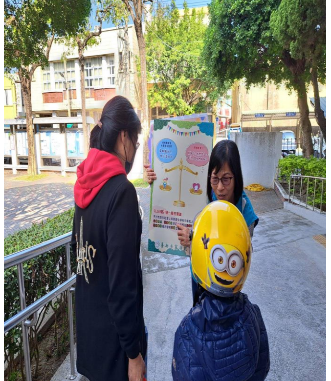
照片說明：CEDAW 文宣做宣導