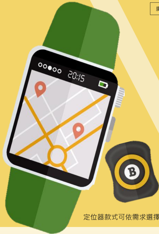
定位器款式可依需求選擇購買