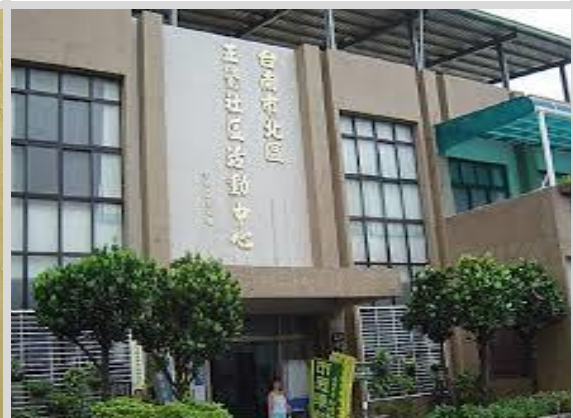
正覺社區活動中心