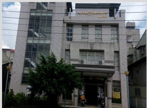
延平六甲里聯合活動中心