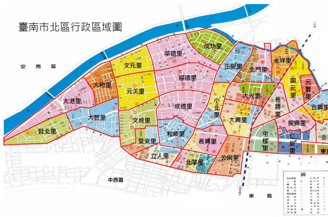
圖 1-1 北區各里地理位置

本篇分析係彙整本區 104 年底至 111 年底 8 年期間之現住人口統計資料，按人口組成之分析、人口動態、婚姻狀況、教育程度等分別分析，供各機關及社會各界參用。