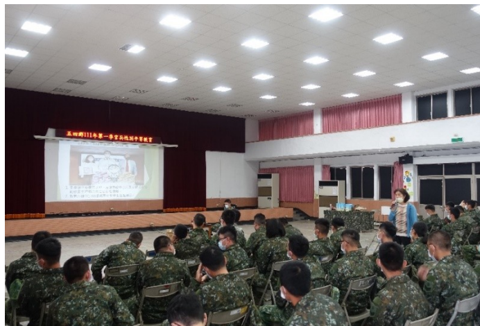
於軍方辦理性平講座宣導