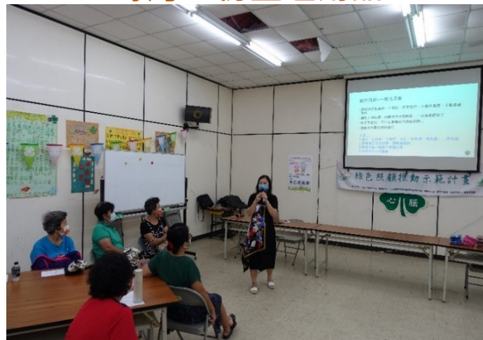
於農會辦理性平講座宣導