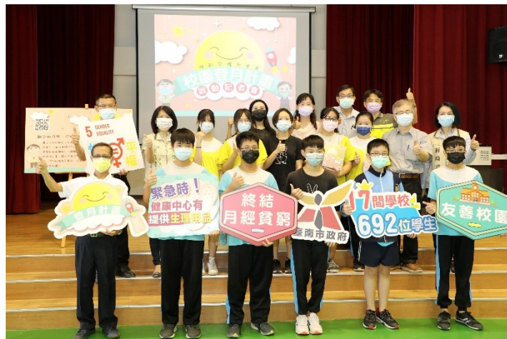
於學校辦理校園 登月計畫記者會