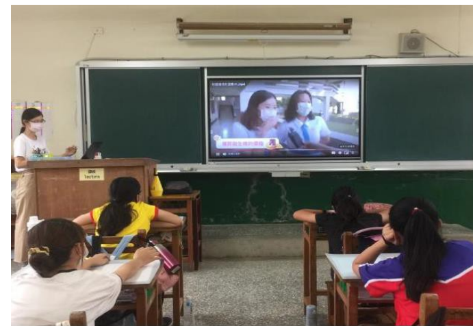
教師宣講月經教育課程