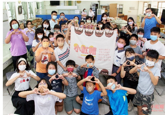
全球小紅帽協會到校宣導