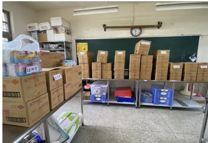
愛心企業捐贈每生 每月 2 份生理用品