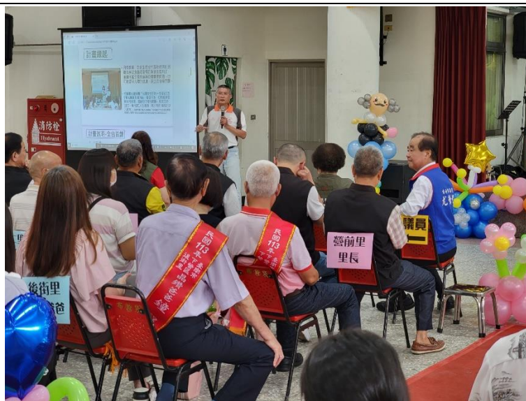
透過性別平等微電影活動，配合宣導登月計畫