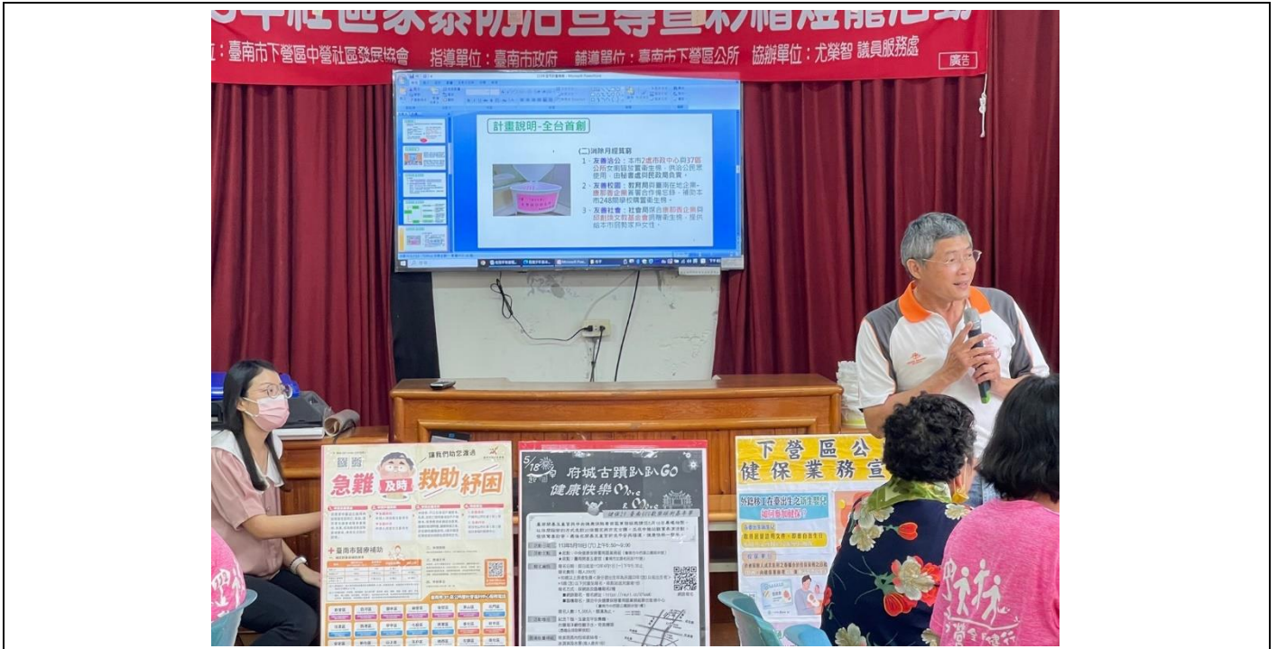
透過性別平等微電影活動，配合宣導登月計畫