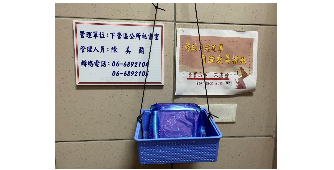
配合登月計畫於廁所放置衛生棉