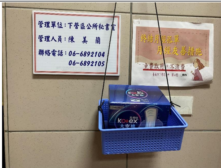
配合登月計畫於廁所放置衛生棉