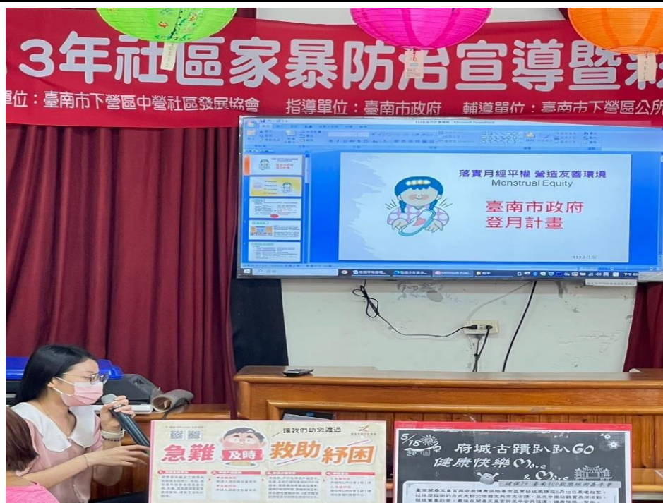
透過性別平等微電影活動，配合宣導登月計畫