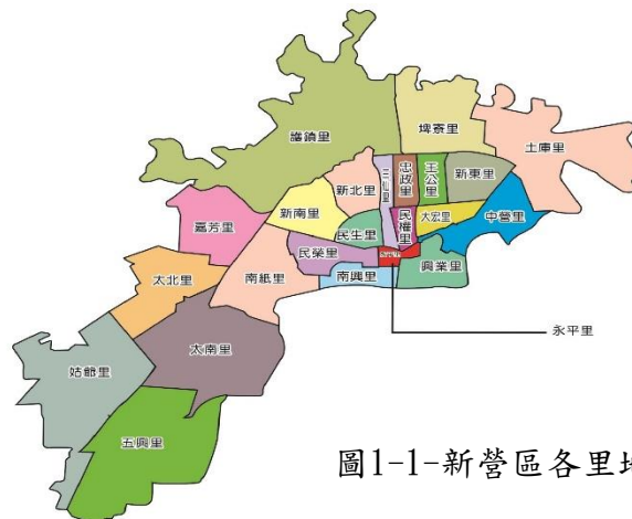
圖1-1-新營區各里地理位置

本篇分析係以本區110年人口趨勢及現況，按戶口數、戶別、性別年齡層、教育程度、婚姻等數據及近年各項數據之呈現為分析範圍。