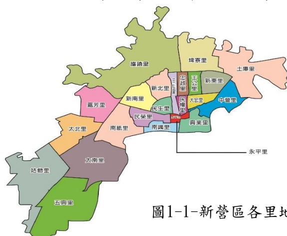
圖1-1-新營區各里地理位置

本篇分析係以本區111年人口趨勢及現況，按戶口數、戶別、性別年齡層、教育程度、婚姻等數據及近年各項數據之呈現為分析範圍。