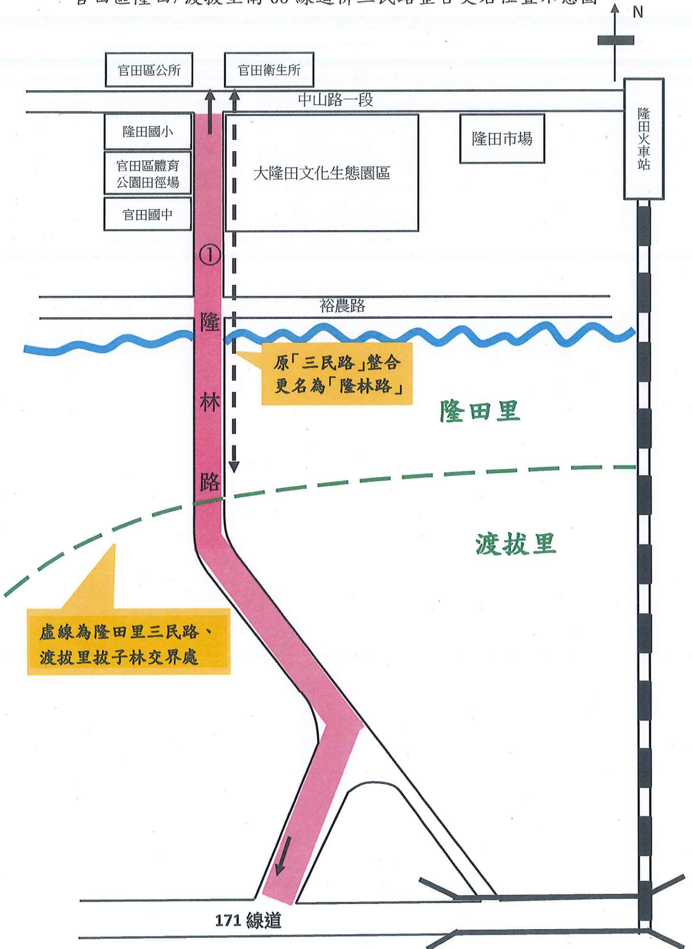
官田區隆田/渡拔里南 65 線道併三民路整合更名位置示意圖