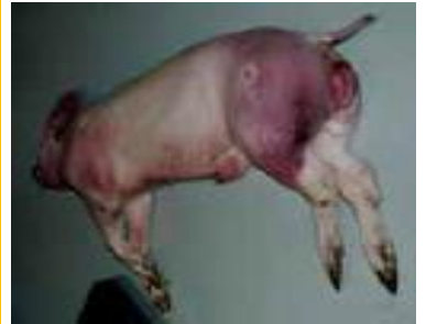
圖：皮下出血及血便