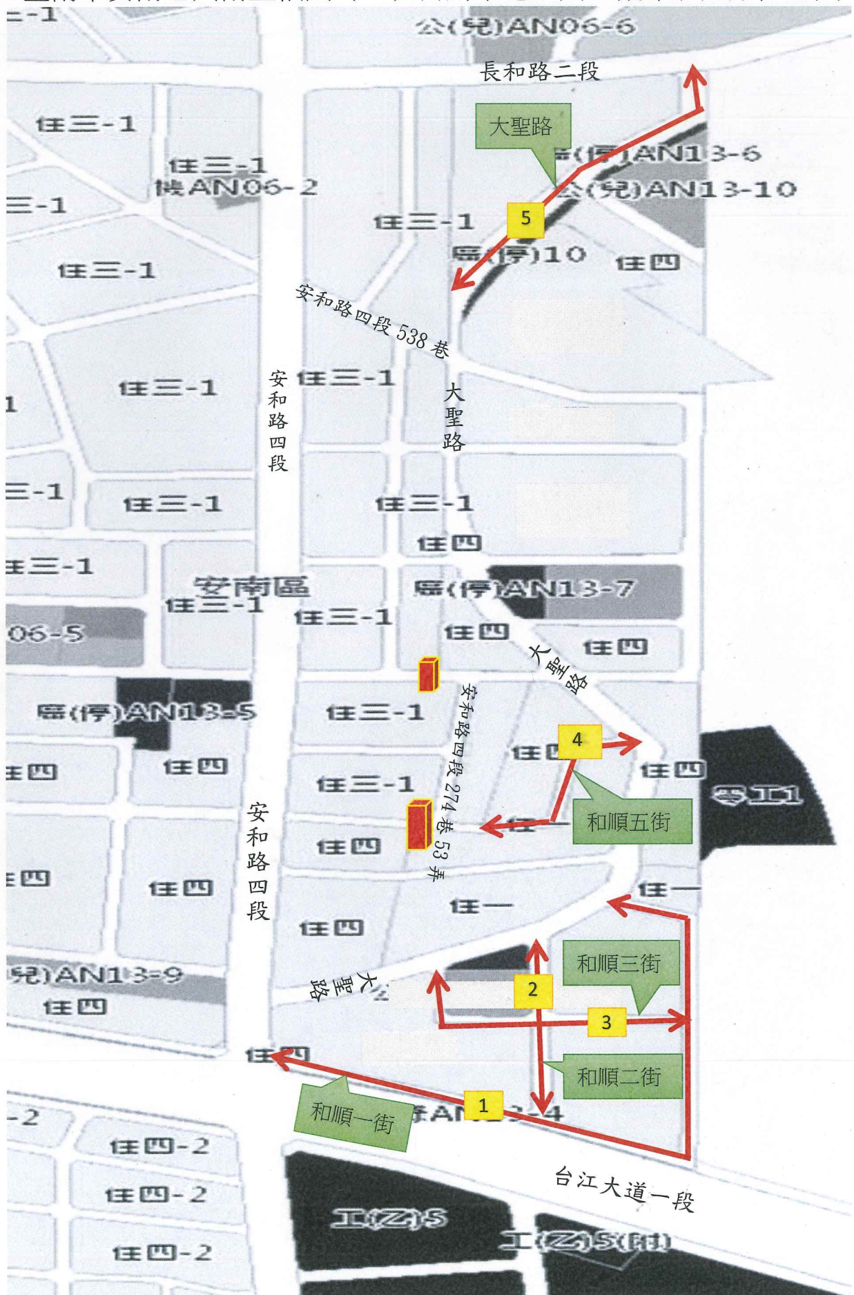
臺南市安南區州南里福國（三）自辦市地重劃區擬命名道路位置圖