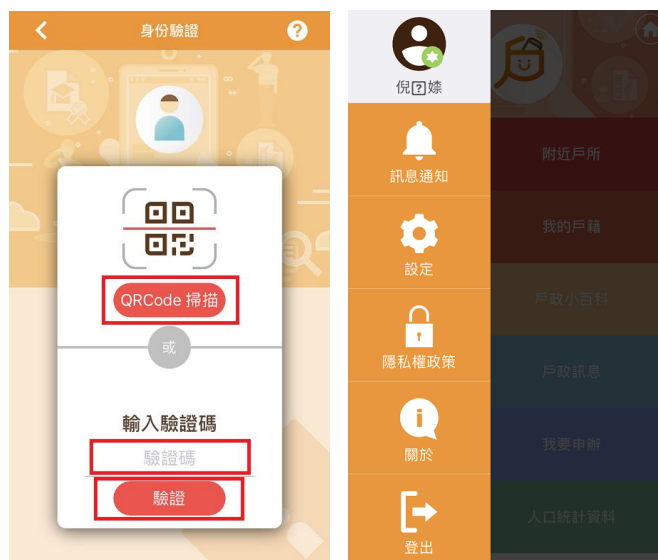
圖 9 操作 APP 完成身分驗證流程說明圖 2