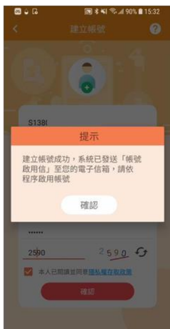
圖 2 建立帳號說明圖 1