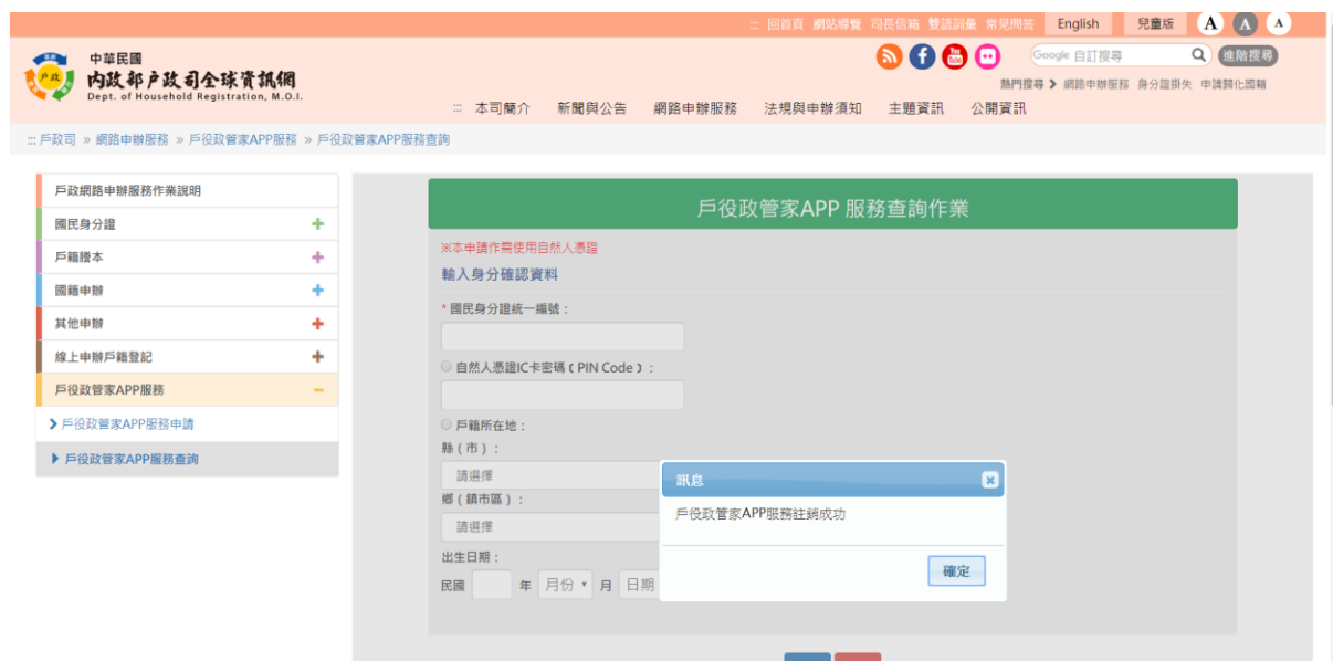
圖 13 戶役政管家 APP 服務查詢作業-停用成功畫面