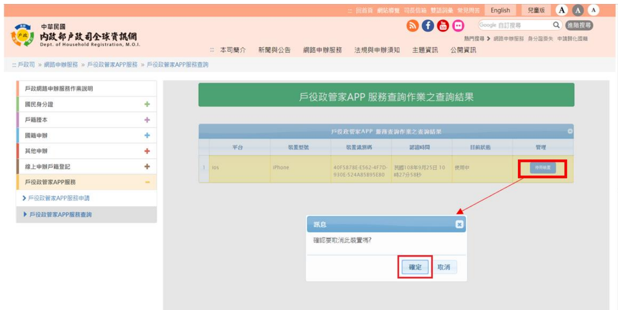
圖 12 戶役政管家 APP 服務查詢作業-點選停用裝置畫面

於「戶役政管家 APP 服務查詢作業」畫面中，點選「停用裝置」之功能鍵，之後按下「確定」鍵。