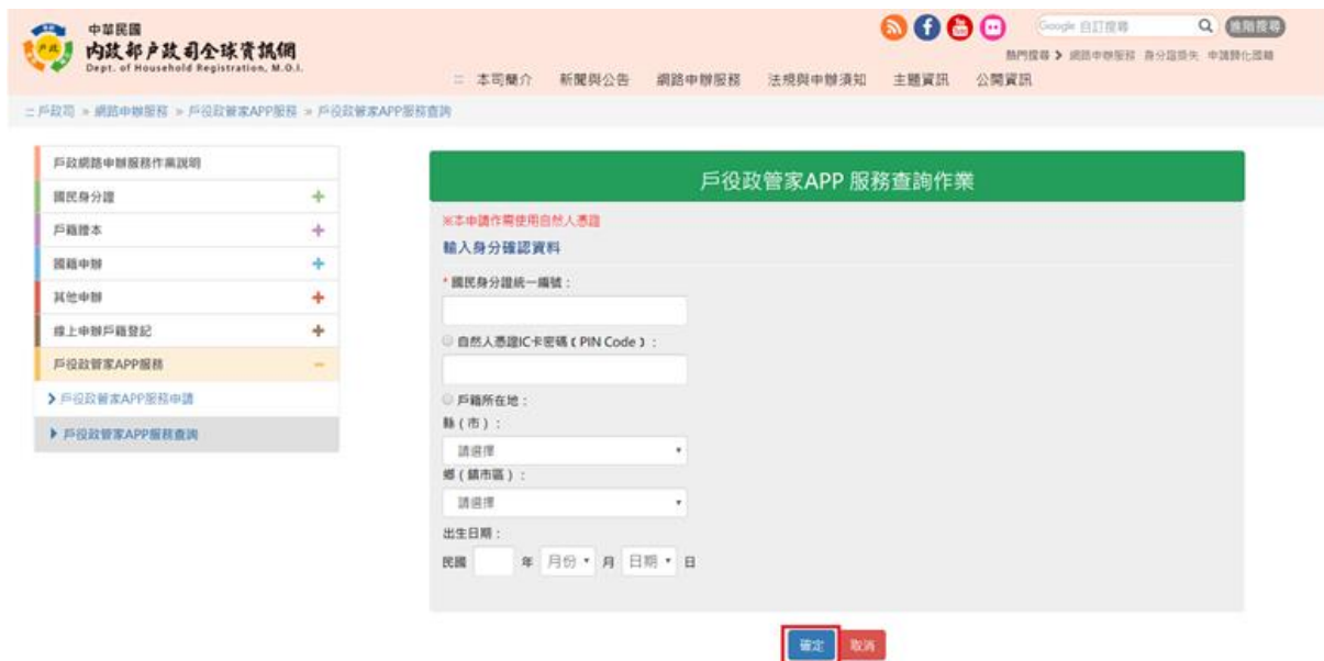
圖 10 戶役政管家 APP 服務查詢作業畫面

於「戶役政管家 APP 服務查詢作業」畫面中，輸入所有必填欄位後，按「確定」之功能鍵，檢驗輸入資料。